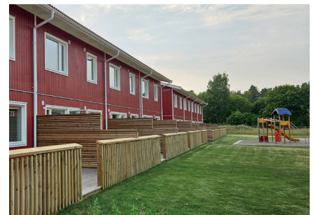
Alla radhus har stora uteplatser in mot gården.