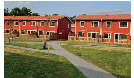
Radhusen är byggda i träkonstruktion som har låg påverkan på miljön.

Vi på Kfast hälsar alla er hyresgäster som flyttat in i våra nybyggda radhus i Skogstorp, varmt välkomna till oss på Kfast! Vi är glada att ha er hos oss och vi hoppas att ni kommer att trivas.